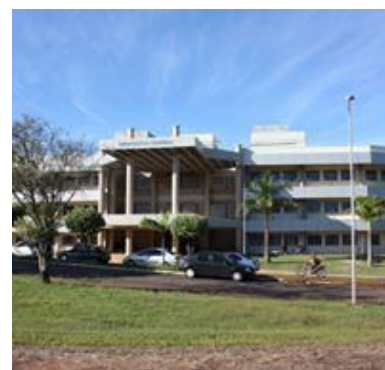
Biblioteca Central localizada no campus da UFMS em Campo Grande

A Biblioteca Central o seu horário de funcio- passou a funcionar em namento estendido. novo horário no início Agora está funcionando de janeiro. Ela abre às de segunda a sexta-feira 6h30 da manhã e fecha das 7h00 às 21h00 (sem às 22h00 (de segunda interrupção no horário a sexta-feira). Aos sá- de almoço). A Secretaria bados, o funcionamento da DIAI oferece serviços é das 6h30 da manhã como: emissão de NA- às 12h00. DA CONSTA; revalida- da identidade funcional para A Secretaria da Divisão ção da carteirinha; con- técnicos e docentes da de Acesso à Informa- feção de 1ª e 2ª via da UFMS de Campo Grande ção (DIAI) também teve carteirinha; habilitação entre outros serviços.